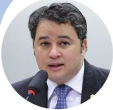
Senador Efraim Filho (PB)

Natural de João Pessoa (PB), é formado em Direito, com especialização em Direito do Consumidor. Atualmente, exerce o seu primeiro mandato de senador.