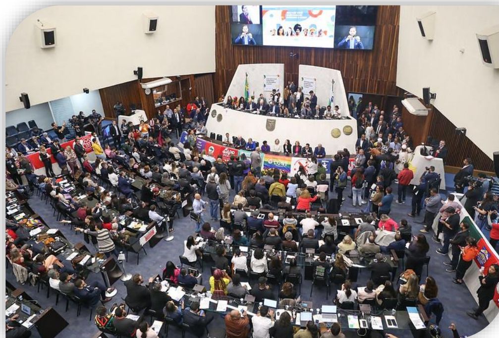
Plenária do PPA Participativo na Assembleia Legislativa do Paraná

Além disso, o PPA foi discutido no Fórum Interconselhos, com mais de 500 participantes e lideranças da sociedade .